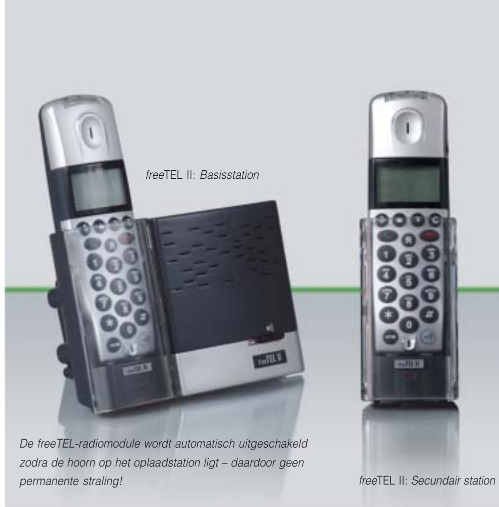
freeTEL II: Basisstation

Het basisstation kan indien gewenst worden uitgebreid met één of meerdere secundaire stations. Op die manier worden de beide componenten gecombineerd tot een comfortabel systeem met buitengewoon elegant design.